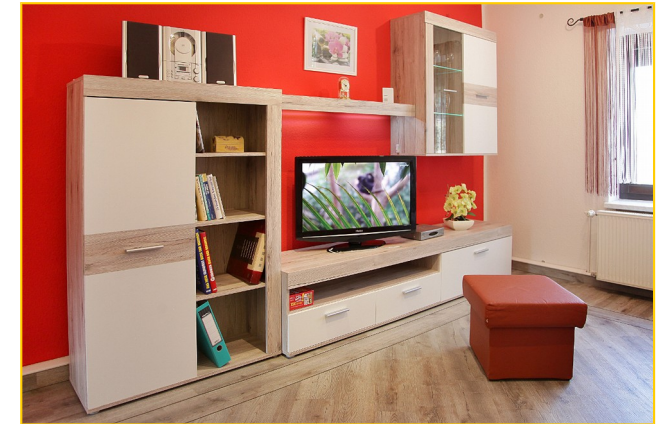
Wohnzimmer mit Essgruppe

in Bautzen ankommend, vom August-Bebel-Platz (ZOB) nach Mücka (Schule) mit der Linie 6 (Fahrzeit ca. 30 Minuten)