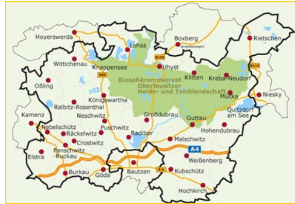
Übersichtskarte Niederschlesischer-Oberlausitzkreis (NOL)

Die Oberlausitzer Heide und Teichlandschaft liegt im östlichsten Teil des Freistaates Sachsen mitten im Dreiländereck Deutschland–Tschechien–Polen, nur wenige Kilometer nordöstlich der Stadt Bautzen.