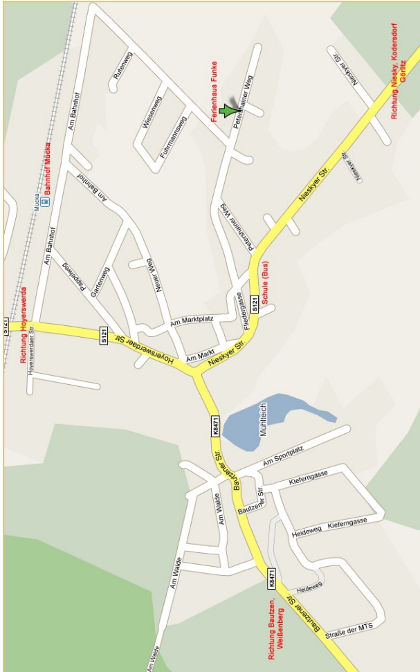
Karte von Mücka

QR-Code Scanner wie barcoo etc. benötigt