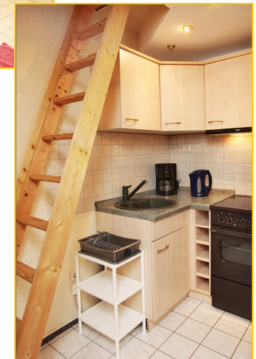
Eingang mit Küchenzeile und Aufgang zum Kriechboden